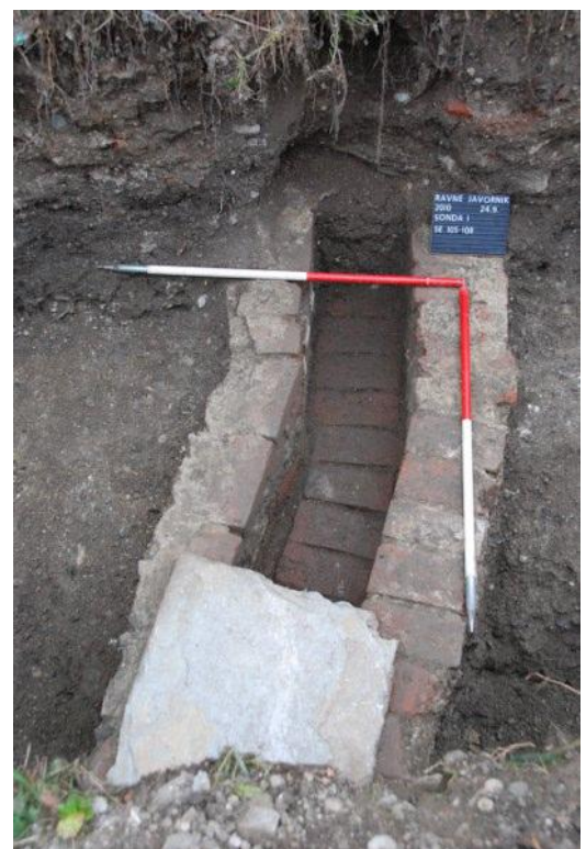
Opečnat kanal s kamnito ploščo